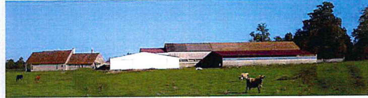
Une construction trop claire s'insère mal dans le paysage

a été signée le 20 juin 2000 sous la présidence du préfet de l'Indre.