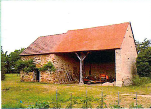
Une harmonie naturelle

Maisons paysannes et bâtiments d'exploitation témoignent d'une longue tradition constructive. Les volumes des bâtiments sont simples, les constructions nouvelles se greffent le plus souvent sans rupture avec les bâtiments existants. Les matériaux de construction d'origine minérale ou végétale sont de couleur mate et plutôt foncée. Ils s'inscrivent sans heurt dans le paysage ■